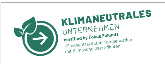
Nicht erlaubt: schräge Platzierung