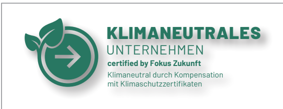
Nicht erlaubt: Platzierung mit Schlagschatten