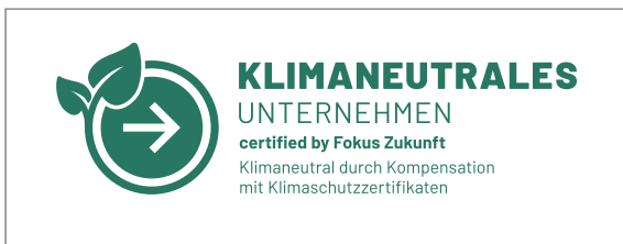
Erlaubt: türkis auf weiß

Wird im Layout ein ruhiges, kontrastarmes Hintergrundbild verwendet, darf das Siegel auf Werbemitteln auch in Weiß auf diesem Foto platziert werden, solange die Lesbarkeit erhalten bleibt.