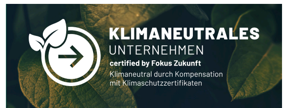
Erlaubt: Platzierung auf kontrastarmem Foto, wenn die Lesbarkeit erhalten bleibt.