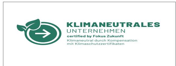
Nicht erlaubt: verzerrte Platzierung