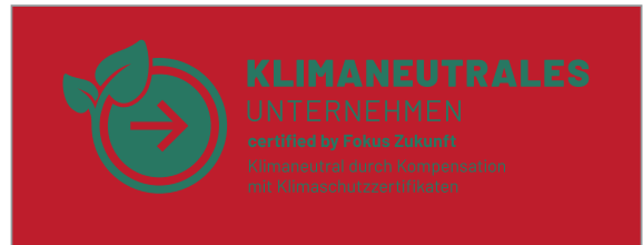
Nicht erlaubt: Platzierung auf Farben, die nicht im Corporate Design aufgeführt sind