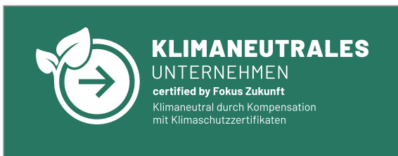
Erlaubt: weiß auf türkis