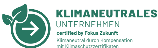
Siegel ohne QR-Code

Wird das Siegel mit QR-Code verwendet, so steht der QR-Code immer mit entsprechendem Abstand rechts vom Siegel. Nur in Ausnahmefällen und nach Absprache darf der QR-Code anders platziert werden (z.B. aus Platzgründen).