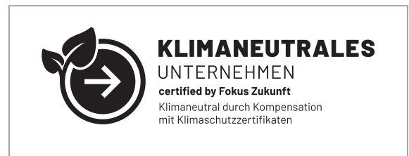
Erlaubt: schwarz auf weiß